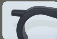
Kralle mit Betätigunselement