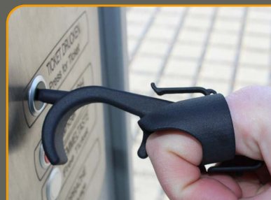
Knöpfe, Schalter, Tasten drücken