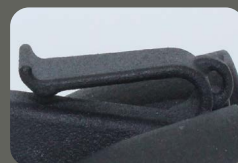
Clip und Öse