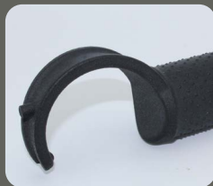
Kralle mit Betätigungselement