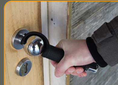
Ziehen an einem Türknauf