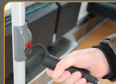
Knöpfe, Schalter, Tasten drücken