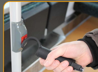
Knöpfe, Schalter, Tasten drücken