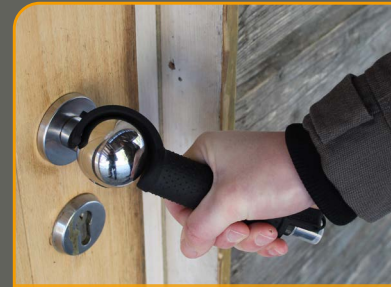
Ziehen an einem Türknauf