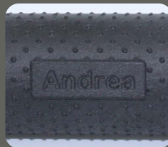
individuelle Personali- sierung möglich