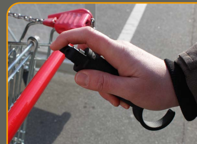
Desinfizieren von Oberflächen