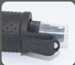
Sprühkopf mit Clip und Öse

Durchmesser Griffstück ca. 30 mm, Länge: 170 mm